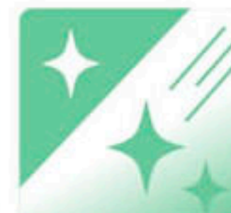
FPCB plating FPCB電鍍 FPCBメッキ