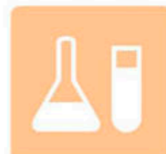
Chemical 特化品 化学薬品